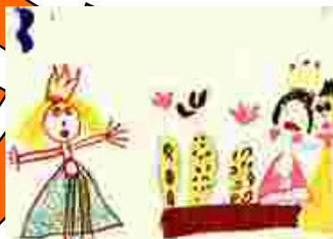
Röcke als Röntgendarstellung. (Mädchen, 5;6 Jahre)