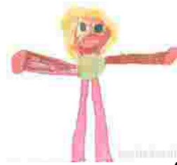
Exakt ein Jahr nach der obigen Kopffüßler-Menschdarstellung malt dasselbe Kind einen Menschen mit Bauch. (Mädchen, 4;10 Jahre)

Neben der Menschdarstellung werden die Elemente des Kopfkreises und der Taster oder Strahlen auch zur Darstellung von Tieren genutzt. Deshalb wird in diesem Zusammenhang auch von einem „ersten Lebewessenschema“ gesprochen. Am Ende der Kopffüßler-Phase wird allerdings eine Umstrukturierung der Schemata notwendig, um die Mitteilungsinhalte der Zeichnungen – die ja für das Kind eine wachsende Rolle zu spielen beginnen – variieren zu können; das Kind fängt an, neben Kreisen und Strichen andere Formen wie etwa Quadrate zu produzieren und für seine Darstellungsabsicht zu nutzen. Es bilden sich aus den beherrschten Grundformen neben Lebewesen auch Häuser mit Fenstern, Autos und Bäume. Das Kind tritt zeichnerisch in die Vorschemaphase ein. Der Kopffüßler verschwindet zugunsten einer realistischeren Menschdarstellung.