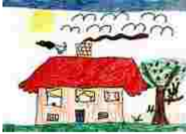
Deutliche Himmels- und Graslinien, sowie Binnendifferenzierungen an vielen Objekten. (Mädchen, ca. 6 Jahre)

Nach dem 5. Lebensjahr spricht man von der „ Werkreife “ der Kinderzeichnung: die Entwicklung von Motiven und die Bildorganisation sind zu einem vorläufigen Abschluss gekommen, das Kind hat die grundlegenden graphischen Merkmale von Personen und Gegenständen erarbeitet. Danach wird das Bild zwar noch detailreicher und weist mehr Verknüpfungen auf, aber es treten keine prinzipiell neuen zeichnerischen Ereignisse mehr ein. Trotzdem macht die Kinderzeichnung auf dem Weg zur nächsten Entwicklungsphase noch einige Veränderungen durch: