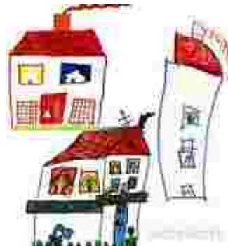
Verschiedene Häuserdarstellungen (Mädchen, 4,3 - 7 Jahre)