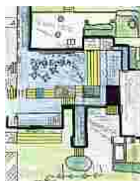
Ausschnitt einer sogenannten "hochformalen" Zeichnung (Grundriss), die allerdings nach der Schemaphase II, im Jugendalter, entstanden ist. (Mädchen, ca. 14 Jahre)