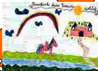
Ein recht typisches Steil- oder Horizontbild. (Mädchen, ca. 9 Jahre)