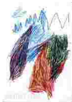
Kritzeln mit nachträglicher Bedeutungsgebung: "Krokodil mit Zunge, das einen Fisch frisst und meine Unterschrift". (Mädchen, 3;7 Jahre)

Von diesem Zeitpunkt an kann das Kind auch wiederholbare Zeichen und Überschneidungen produzieren wie das „Urkreuz“, welches in der folgenden Zeit auf vielen Bildern des Kindes einen Niederschlag findet und auch einen Übergang zu differenzierteren Darstellungen herstellt (siehe „Kopffüßler“). Auch die Fähigkeit, ein kreisartiges Gebilde zu einem geschlossenen Kreis zusammenzuführen, weist auf das Ende der Kritzelphase hin (um das dritte Lebensjahr herum).