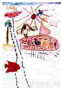
Ein Bild, das zur Vorschema-Phase gerechnet werden könnte. (Mädchen, 4;10 Jahre)