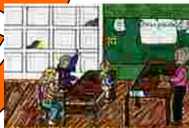
Objekte mit dritter Dimension (Tische, Schrankfächer) (Mädchen, 11 Jahre)